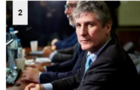
Tres años de prisión en suspenso para Boudou en la causa de los papeles