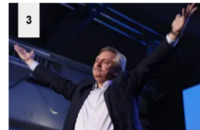
El escrutinio definitivo amplió levemente la ventaja de Fernández sobre Macri

https://www.lanacion.com.ar/politica/condenaron-amado-boudou-a-anos-prision-nid2282719